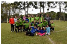
Equipe ADMG/Mottin, campeã

A 15ª edição da Copa Sicontiba/Sescap de Futebol Suíço teve uma final eletrizante, com a equipe ADMG/Mottin vencendo a Labor por 4 a 2 e levando o troféu de campeã da competição, que contou com a participação de 11 equipes: ADMG/Mottin, Barczik, Bayer de Curitiba, Consult, Falidos, Jorhen, Labor, Morona, MV, West Rum e WR.