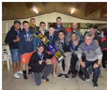
Equipe MV, terceiro lugar

A 15ª edição da Copa Sicontiba/Sescap de Futebol Suíço teve uma final eletrizante, com a equipe ADMG/Mottin vencendo a Labor por 4 a 2 e levando o troféu de campeã da competição, que contou com a participação de 11 equipes: ADMG/Mottin, Barczik, Bayer de Curitiba, Consult, Falidos, Jorhen, Labor, Morona, MV, West Rum e WR.